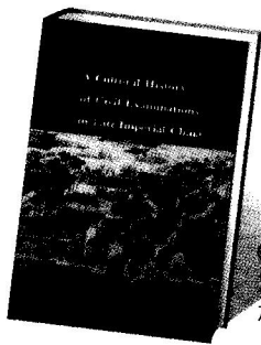
《中华帝国后期的科举文化史》英文版 艾尔曼著 加州大学出版社2000年版

就应将四书重新放回第二场中。结果，士子仍可阅读广为流通的各类四书文，而回避对四书的研究（《十斋斋养新录》卷十八）。类似的说法，如孙星衍（1753—1818）在一封奏折中的建言，他说应该在科目中，恢复汉唐注疏，以补明初以来所定宋儒注疏的不足（《拟科场试士请兼用注疏折》）。然而，他们两人的意见均似未见成效。