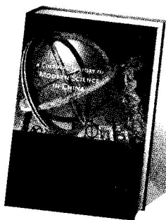
《中国现代科学的文化史》英文版 艾尔曼著 哈佛大学出版社2006年版

判亦愈演愈烈，有清一代的学者在四书五经的评价问题上聚讼纷纭。经典仍然是神圣的，但人们开始用新的眼光和策略来诠释它们。十七世纪的中国儒家多少受到耶稣传教士的影响，开始用自然哲学和新的天文学观点来重估经典，并试图恢复古学，这股学风影响亦及日、韩。