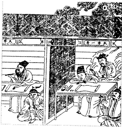
艾尔曼《中华帝国后期的科举文化史》 书中采自《明状元图考》中的插图

晚清帝国急于改革，是为了应对来自太平天国（1851—1864年）和西方帝国主义的挑战。太平天国在一八五〇年代甚至创立了以基督教为基础的科举制度。当科举考试丧失了原有的文化光彩，甚至沦为士人奚落的对象时，科举制度便被讥讽为一种应被抛弃的、“变态的”教育制度。到二十世纪初期，新涌现的政治、体制和文化形式，向晚期帝国的教条体系发起挑战，并迫使其教育制度向西方靠拢（internationalize）。皇帝、王朝官僚体系以及儒家文化形式，迅速变成了“落后”的象征。传统形式的知识被理所当然地贴上了“迷信”的标签，而欧美“现代科学”被新式知识分子当作通往知识、启蒙和国族强盛的必由之路。光绪三十至三十一年（1904—1905）科举制度在政治、社会及文化功能上的全面解体，最好地显现了这场巨变。无论是改良还是革命的拥护者，都太过仓促地拆解了诸如科举这样的王朝制度，他们低估了这些历经两个朝代、有着五百年历史的制度对公众的影响力。